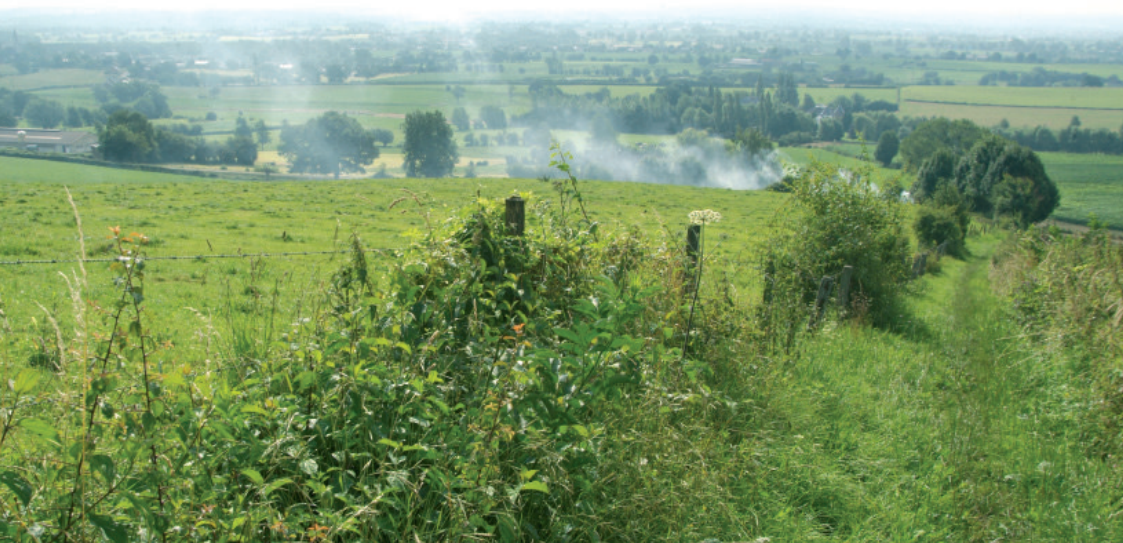
Vue à "Te Berg".