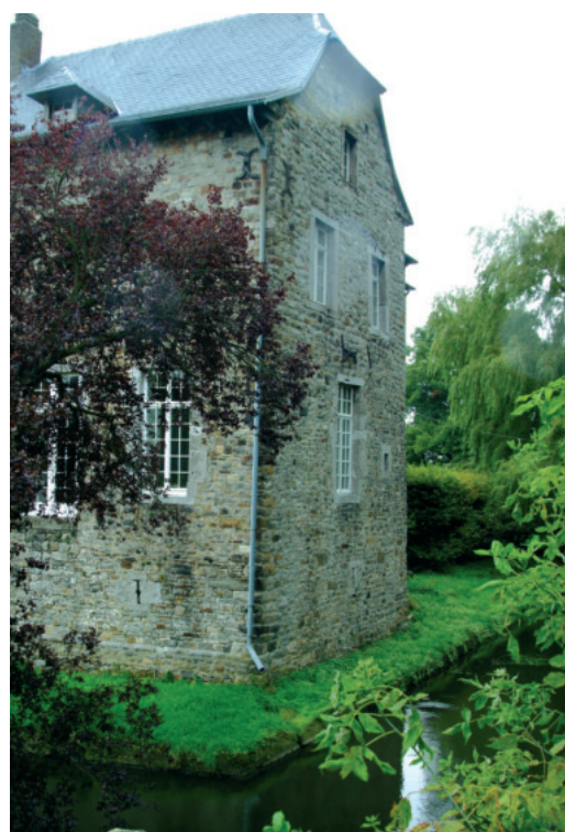
Château de Broich

Aussi appelé « château de Graaf » parce que le propriétaire était comte au 18 e siècle (Graaf = comte, en dialecte régional). Ce remarquable château médiéval est implanté au creux d'un vallon et entouré d'étangs. Protégé par de larges douves, il est accessible par un pont de pierres à trois arches menant jadis au pont-levis. L'ensemble, de plan quasi carré, est ponctué aux angles N-O et S-O de tours circulaires du début du 16 e siècle, l'une